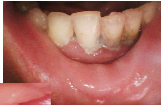
Рисунок 4. Набряклі та гіперемовані ясна, зубні відкладення