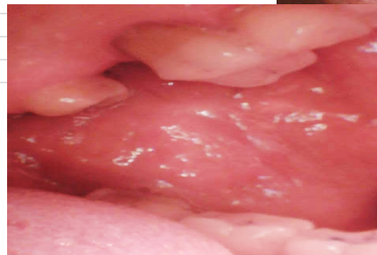
Рисунок 3. Набряк слизової оболонки щоки